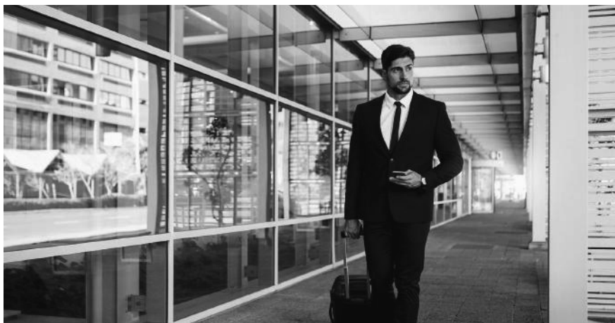
A1-Bescheinigung dabei? Sie ist für alle Aktivitäten im Ausland nötig.

entrichten hat. Es ist für sämtliche grenzüberschreitenden Tätigkeiten nötig, beispielsweise für Berater, Künstler, Journalisten oder Mitarbeiter im Transport oder Baugewerbe, und zwar auch dann, wenn der Aufenthalt nur wenige Stunden beträgt. Ausgestellt wird die A1-Bescheinigung von der AHV-Ausgleichskasse im Wohnsitzland des betroffenen Arbeitnehmers, beantragt wird sie vom Arbeitgeber des Entsandten bzw. direkt vom Selbständigerwerbenden.