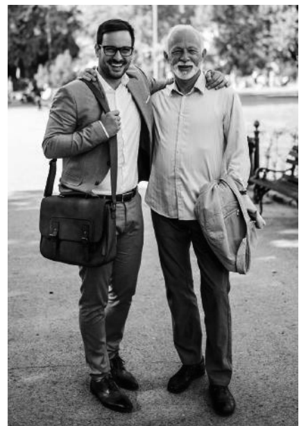
Finanzierung nach dem Umlageverfahren: zuerst einzahlen, später beziehen.