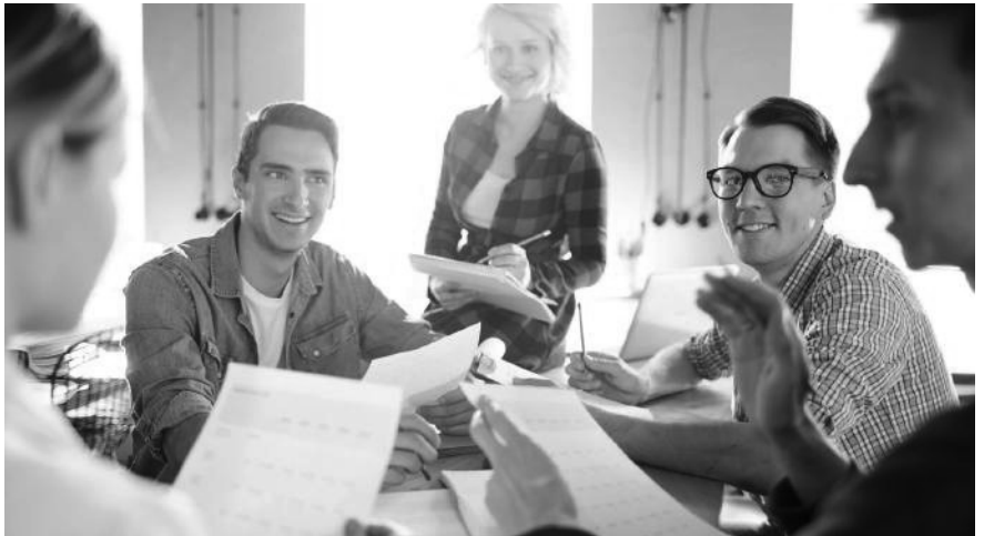
Aktionärsbindungsvertrag: ein sinnvolles Instrument, um in guten Zeiten vorausschauende Regelungen für schwierige Phasen zu definieren.

Fast alle Aktionärsbindungsverträge sehen Veräusserungsbeschränkungen vor, gerade in Familienbetrieben und Aktiengesellschaften mit wenigen Aktionären. Beispielsweise erwirbt man mit einem Kaufrecht das Recht, Aktien zu erwerben, ohne dass die Zustimmung der anderen Partei erforderlich wäre. Das kann sinnvoll sein, wenn ein Unternehmensaktionär bei der Gründung nicht das ganze Aktienkapital aufbringen kann, aber später den Anlegeraktionär auskaufen will. Vorhandrechte wiederum verpflichten dazu, seine Aktien der anderen Partei anzubieten, bevor ein Vertrag mit einem Dritten abgeschlossen wird. Ein Vorkaufsrecht berechtigt dazu, anstelle eines Dritten zu den Konditionen,